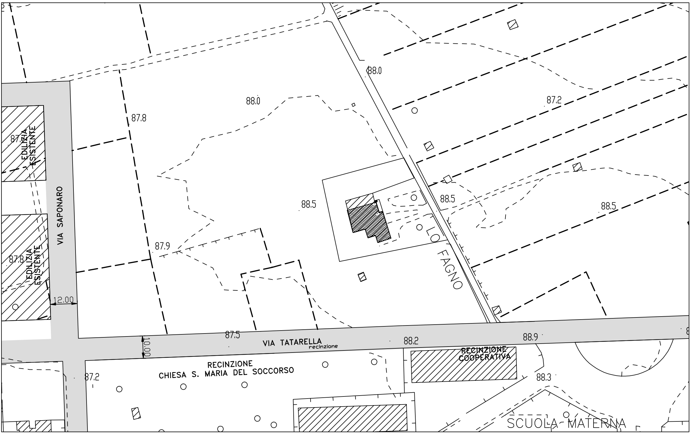
STRALCIO AEROFOTOGRAMMETRICO STATO DEI LUOGHI Sc 1:1000