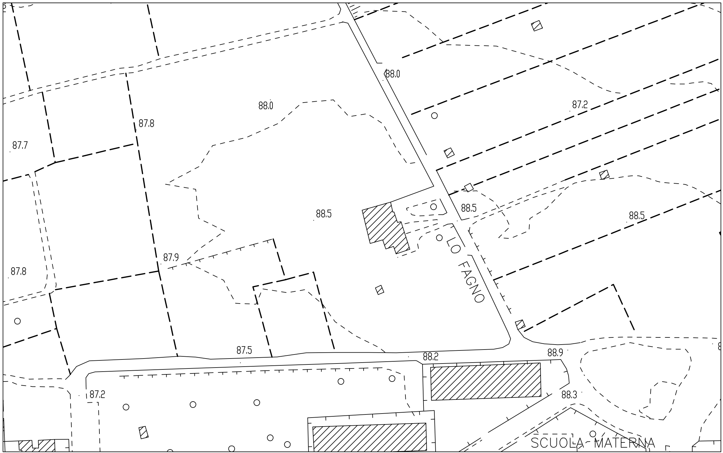
STRALCIO AEROFOTOGRAMMETRICO Sc 1:1000